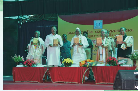
युवमहोत्सवस्य उद्घाटनसत्रस्य दृश्यमेकम्