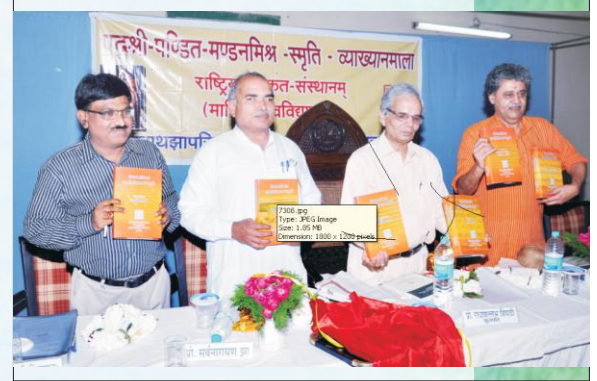
सङ्गोष्ठ्याः उद्घाटनभाषणं कुर्वन् कुलपतिः

एतस्मिन् त्रिदिवसीय-संस्कृतदिवससमारोहे परिसरे बहुविधाः स्पर्धाः आयोजिता। तद्यथा - श्रीमद्भगवद्गीतापाठस्पर्धा, श्रीविष्णुसहस्रनामस्तोत्रपाठस्पर्धा, संस्कृतप्रश्नोत्तरीस्पर्धा अन्त्याक्षरीप्रतियोगिता चेति चतस्रः प्रतियोगिताः आयोजिताः, यासु नगरस्य विविधाविद्यालयेभ्यः, इलाहाबादविश्वविद्यालयाच्च छात्रा भागं गृहीतवन्तः। ०८.०८.१२ तमे दिनाङ्के समायोजिते समापनोत्सवे एतासु स्पर्धासु