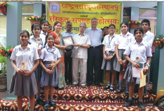
संस्कृतसप्ताहाङ्गतया आयोजितस्पर्धासु विजेतृभ्यः पुरस्कारं प्रायच्छन्तः कुलपतिप्रमुखाः