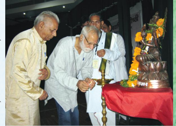
कार्यशालायाः उद्घाटनं कुर्वन्तः अतिथयः