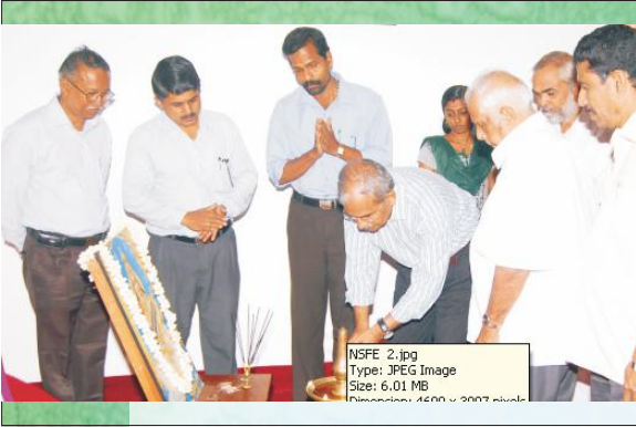
NSFE 2.jpg Type: JPEG Image Size: 6.01 MB Resolution: 4608 x 3007 pixels

प्रशिक्षणवर्गस्य उद्घाटनं कुर्वन्तः विद्वांसः