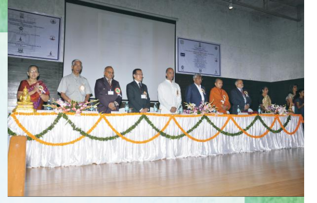
सङ्गोष्ठ्याः उद्घाटनसत्रस्य दृश्यमेकम्