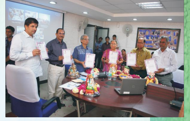
मु.स्वा.पीठस्य प्रकाशनानि लोकार्पयन्त कुलपतिप्रमुखाः अतिथयः