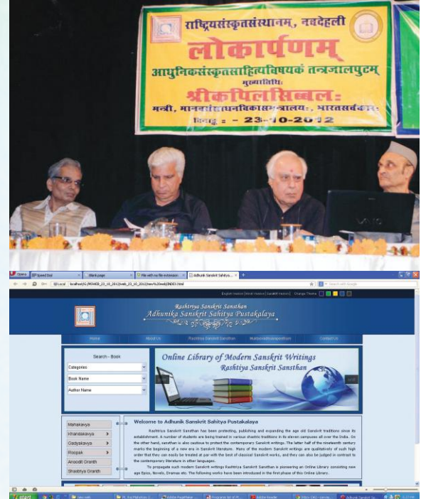
'आधुनिकसंस्कृतसाहित्य-पुस्तकालयः' इत्यस्य अन्तर्जालपुटस्य लोकार्पणस्य दृश्यम्