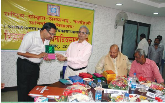
हिन्दीपक्षोत्सवाङ्गतया आयोजितस्पर्धासु विजेतृभ्यः पुरस्कारान् प्रयच्छन् कुलपतिः