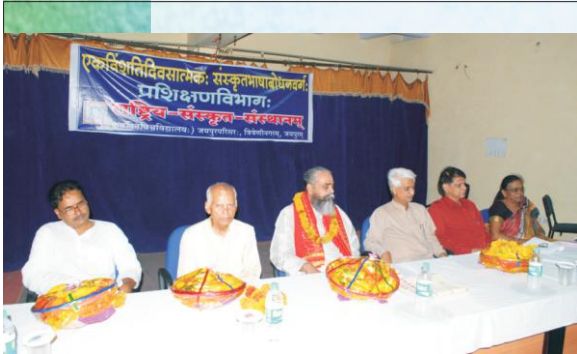
संस्कृतभाषाबोधनवर्गं मञ्चासीनाः विद्वांसः