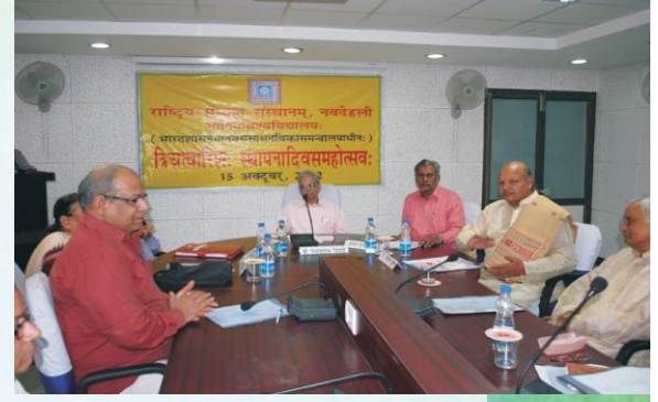
स्थापनादिवससमारोहे समुपस्थिताः विद्वांसः