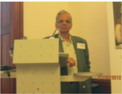
सङ्गोष्ठ्याः उद्घाटनभाषणं कुर्वन् कुलपतिः