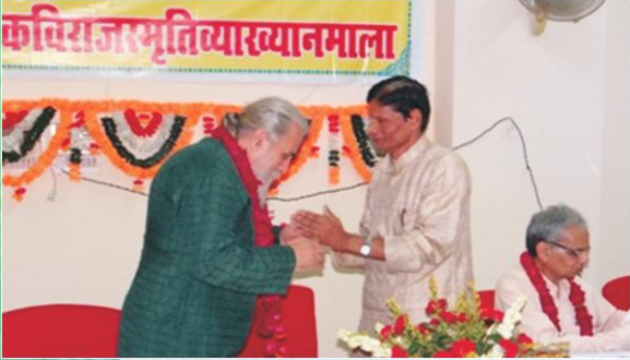
आचार्यमार्कमहोदयं सम्मानयन् प्राचार्यः