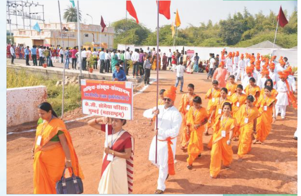
शोभायात्रायाः किञ्चन दृश्यम्