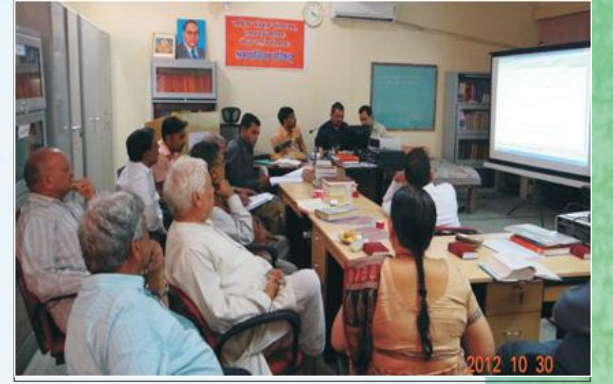
कार्यशालायां विचारयन्तः विद्वांसः