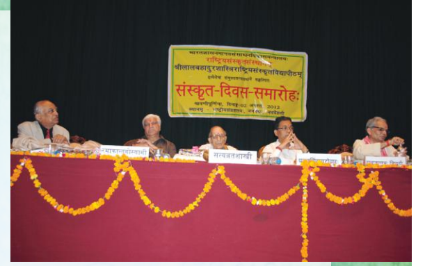
संस्कृतदिवससमारोहे मञ्चासीनाः विद्वांसः