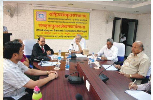
संस्कृतानुवादलेखनकार्यशालायाः किञ्चन दृश्यम्