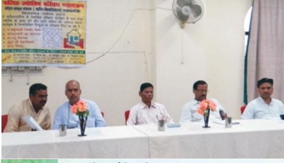
फलितज्योतिषपरिचयपाठ्यक्रमस्य उद्घाटनस्य किञ्चन दृश्यम्