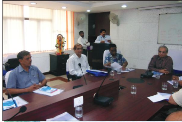
संस्कृत-हिन्दी-भाषानुवाद-कार्यशालायाः किञ्चन दृश्यम्