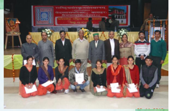
राज्यस्तरीयस्पर्धासु पुरस्कृताः छात्राः

दशदिवसीया स्पर्धाप्रशिक्षणकार्यशाला - परिसरस्य मार्गदर्शन-नियोजनप्रकोष्ठेन एका दशदिवसीया स्पर्धाप्रशिक्षणकार्यशाला १९.१२.२०१२ दिनाङ्कात् सञ्चालिता।