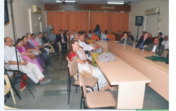
सङ्गोष्ठ्यां समवेताः विद्वांसः