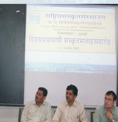
संस्कृत-सप्ताहोत्सवे भाषमाणः कुलसचिवः