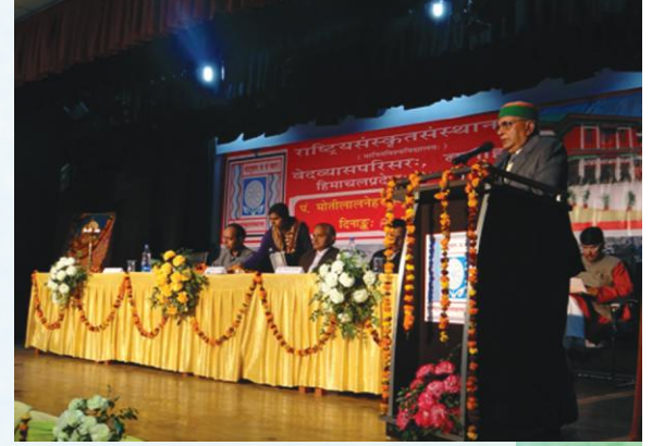
मोतीलालस्मारकव्याख्यानकार्यक्रमस्य किञ्चन दृश्यम्