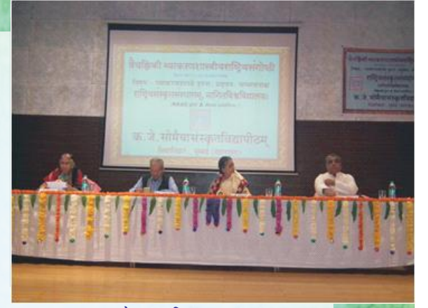
सङ्गोष्ठ्याः किञ्चन दृश्यम्