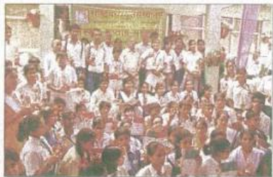
विपदी ने वर्तमान युग को संस्कृत का सर्वोत्तम वातावरण तथा संस्कृत के विरचनार्थी प्रचार प्रसार पर जोर दिया।