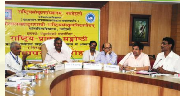
सङ्गोष्ठ्याः समापनसमारोहस्य एकं दृश्यम्