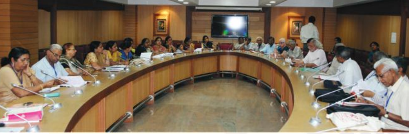
कस्यचित् सत्रस्य एकं दृश्यम्