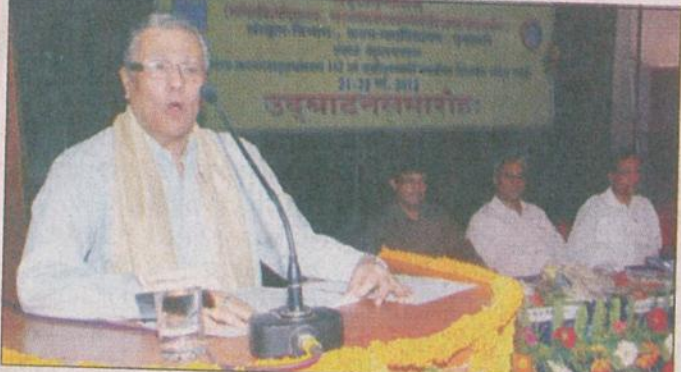
आलोचना-चक्रत भाषणत उच्चतम न्यायालयत प्राञ्जन न्यायाधीश मुकुन्दकाम शर्मा।