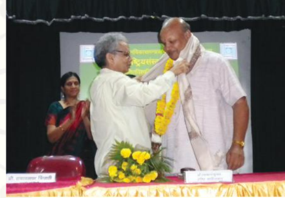
आचार्यरमाकान्तशुक्लस्य अभिनन्दनं कुर्वन् आचार्यराधावल्लभत्रिपाठी