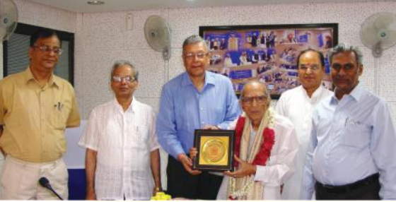
संस्थाने समायोजितस्य अभिनन्दनकार्यक्रमस्य किञ्चन दृश्यम्

साम्प्रतमयं महोदयः ०३.०५.२०१२ दिनाङ्के इटलीस्थ-टोरिनोविश्वविद्यालयस्य विशिष्टदीक्षान्तसमारोहे डाक्टरेट (Doctorate Honoris Causa) इति मानार्थोपाधिना सभाजितो वर्तते। एतस्य सम्माननस्य कृते राष्ट्रियसंस्कृतसंस्थाने आचार्यः सत्यव्रतशास्त्रिमहोदयः संस्थानस्य सारस्वतसभागारे समायोजिते एकस्मिन् विशिष्टे कार्यक्रमे कुलपतिप्रमुखैः संस्थानसदस्यैः अभिनन्दितः।