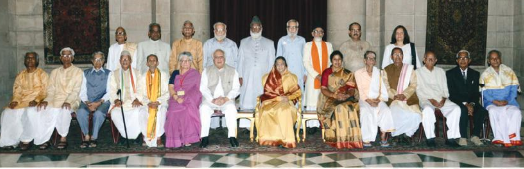
२०१० तमस्य वर्षस्य कृते सम्मानितानां विदुषां समूहचित्रम्

राष्ट्रपतिसम्मानं प्राप्तुम् एते विद्वांसः कार्यक्रमे समुपस्थिताः आसन्-