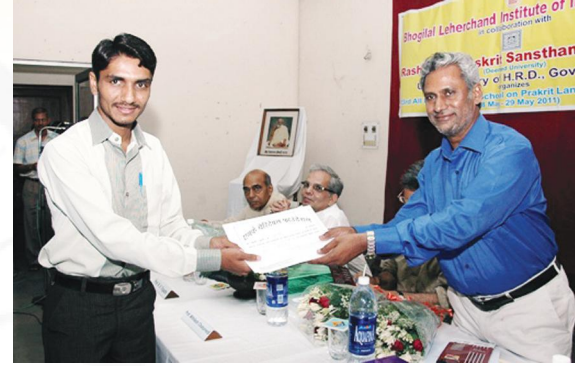
प्रमाणपत्रप्रदानावसरस्य किञ्चन दृश्यम्

पाठ्यशालायामस्यां विशिष्टप्राकृतव्याकरणशैलीमाध्यमेन छात्राः बोध्यन्ते, येन हि