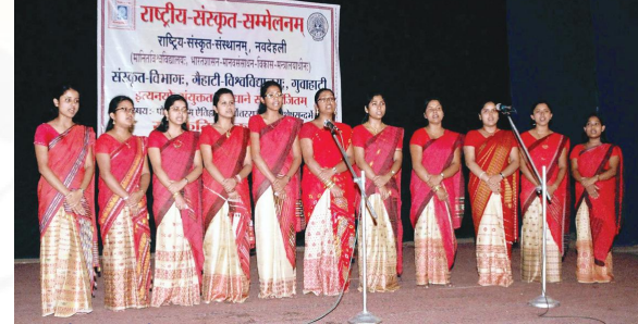
सम्मेलनावसरे प्रस्तुतस्य कस्यचित् सांस्कृतिककार्यक्रमस्य दृश्यम्

सम्मेलनेऽस्मिन् त्रिष्वपि दिनेषु शैक्षिकसत्राणि प्रवृत्तानि। एषु सत्रेषु विद्वांसः