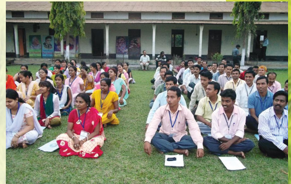
प्रशिक्षणं प्राप्नुवन्तः प्रतिभागिनः