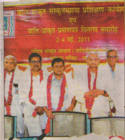
राष्ट्रीय संस्कृत संस्थान, गोमती नगर में बुधवार को प्रशिक्षण कार्यक्रम के बाद सम्मानित किये गये आचार्य एवं छात्र-छात्रायाँ