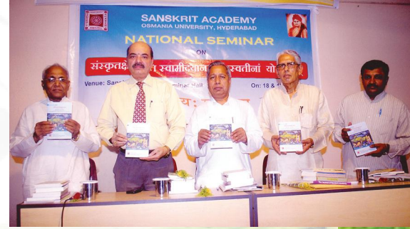
ग्रन्थलोकार्पणस्य किञ्चन दृश्यम्