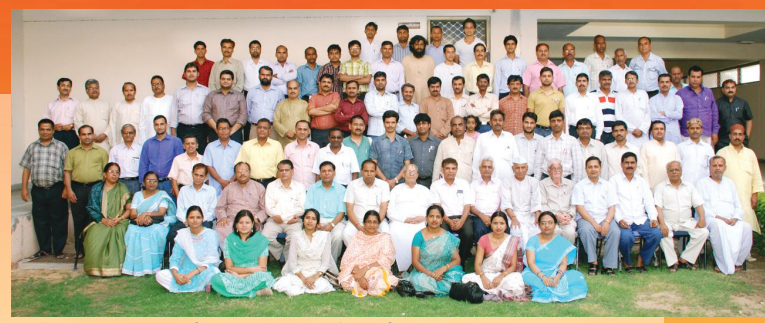
केन्द्रीयमूल्याङ्कनार्थं समवेतानां विदुषां समूहचित्रम्