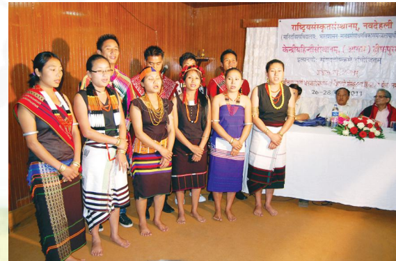
उद्घाटनावसरे प्रस्तुतस्य संस्कृतगीतगायनस्य दृश्यमेकम्