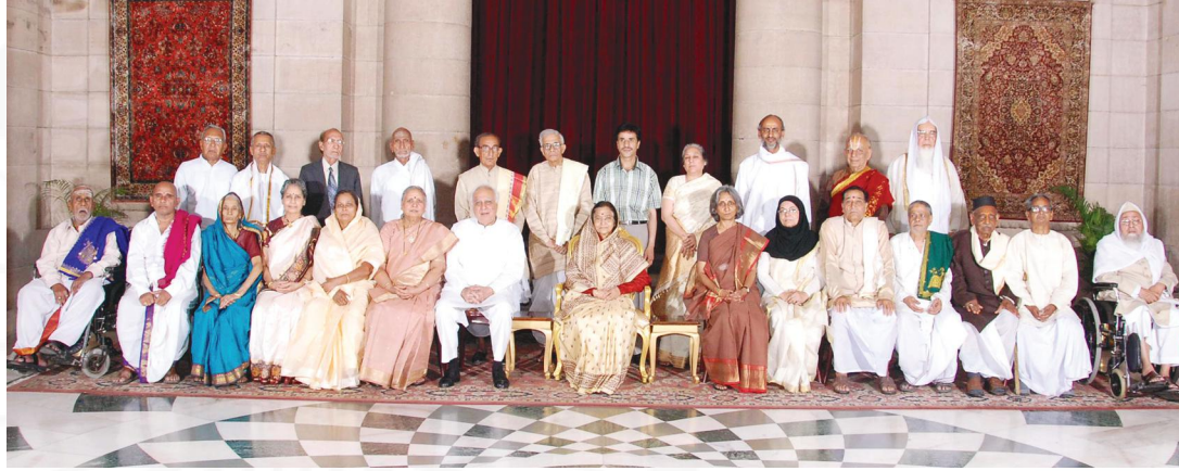
२००८ तमे वर्षे राष्ट्रपतिसम्मानपत्रप्राप्तकर्तृणां विदुषां किञ्चन समूहचित्रम्