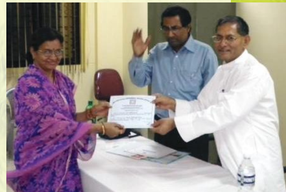
प्रमाणपत्रवितरणस्य किञ्चन दृश्यम्