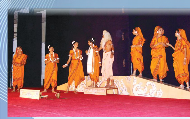
शृङ्गेरीच्छात्रैः प्रदर्शितम् अभिज्ञानशाकुन्तलम्