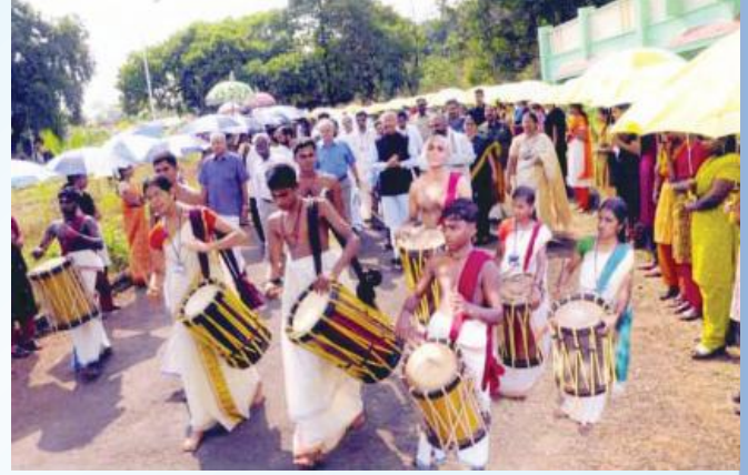
वाद्यघोषेण अतिथीनां स्वागतम्