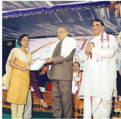
तिरुपतौ छात्रप्रातिभसमारोहे पुरस्कारं प्राप्नुवत्यौ पुरीपरिसरच्छात्र्यौ

यस्मिन् जीवति जीवन्ति बहवः सोऽत्र जीवतु। काकाः किं न कुर्वन्ति चञ्च्वा स्वोदरपूरणम्॥