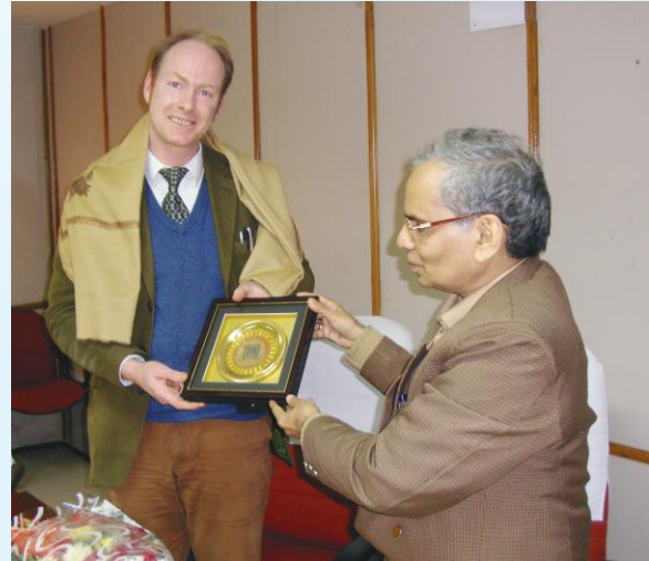
ब्राडबेकमहोदयं सम्मानयम् कुलपतिः

भारतस्य पूर्वोत्तरभागे विद्यमाने त्रिपुरा-राज्ये राष्ट्रियसंस्कृतसंस्थानस्य एकः परिसरः भवेदिति सम्भाव्यते। त्रिपुराराज्यशासनेन राज्यराजधान्याम् अगरतलायां संस्थानपरिसराय भूमिं प्रदातुम् इच्छा प्रकटिता।