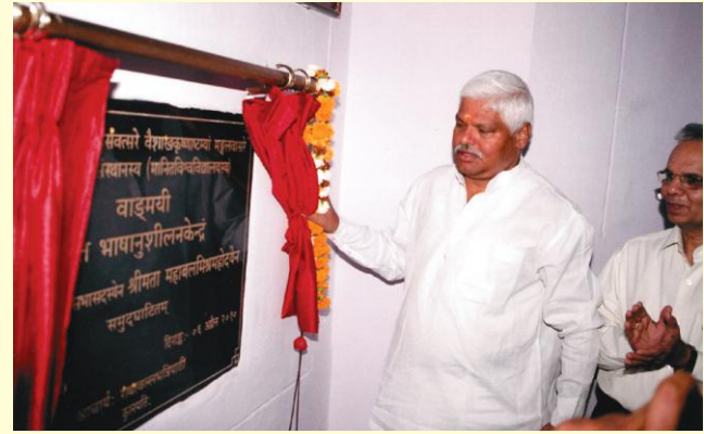
वाङ्मयी-इत्यस्य केन्द्रस्य शुभारम्भं कुर्वन् श्री-महाबलमिश्रः

६-४-२०१०तमे दिनाङ्के संस्थानमुख्यालये 'वाङ्मयी'-इत्यस्य भाषानुशीलन-केन्द्रस्य उद्घाटनमभूत्। पश्चिमदिल्ली-लोकसभासदस्यः श्रीमान् महाबलमिश्रः भाषानुशीलनकेन्द्रमिदं समुद्घाट्य रा.सं.संस्थानस्य विकासाय सर्वविधं साहाय्यं यथाशक्ति विधास्यते इति प्रतिज्ञातवान्।