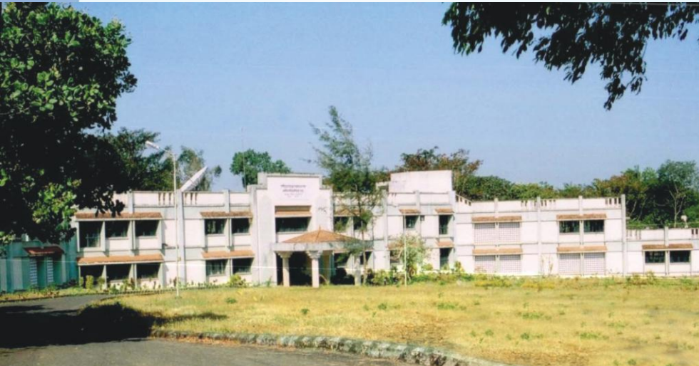
पुरनाट्टुकरायां राजते नूतनभवनसमूहः