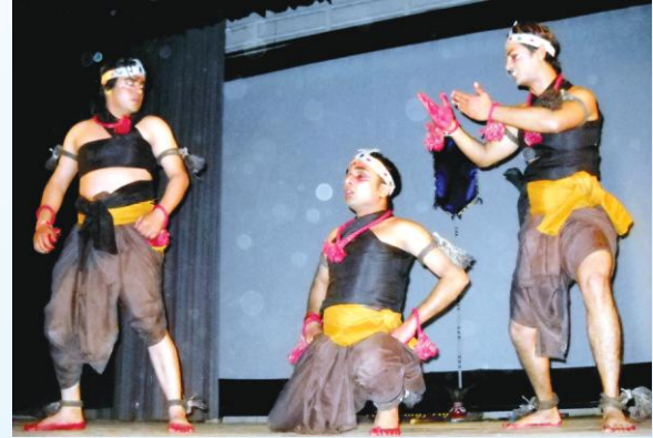
लखनऊस्थ-निसर्गस्य प्रस्तुतिः ऊरुभङ्गम्