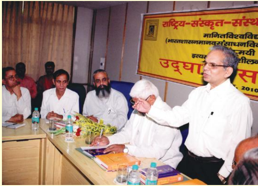
वाङ्मय्याः उद्घाटनसभायां भाषमाणः कुलपतिः