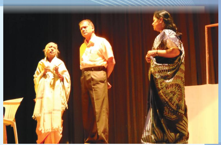
क.कु.गु.का.सं.वि. विद्यालयस्य प्रस्तुतिः-विकसतु एषा कलिका