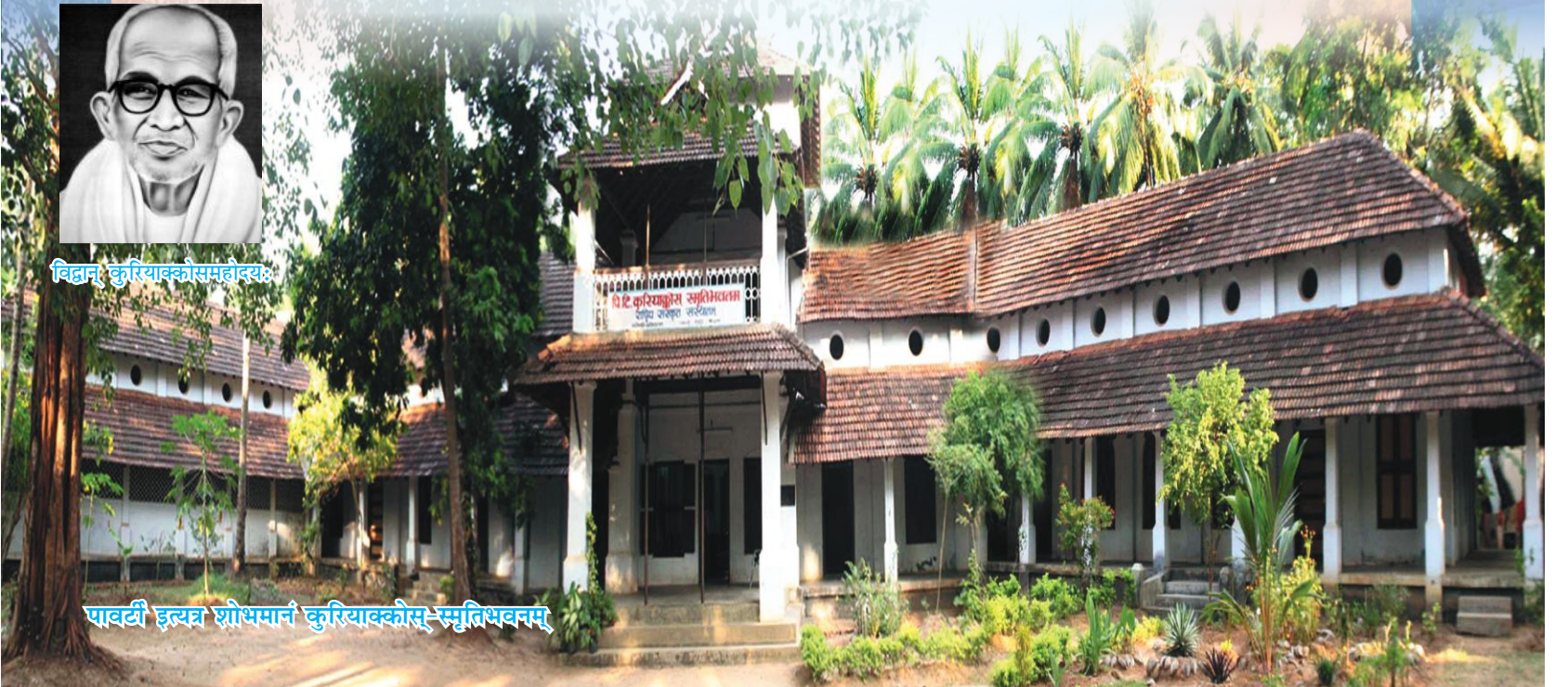
पावर्टी इत्यत्र शोभमानं कुरियाक्कोस्-स्मृतिभवनम्