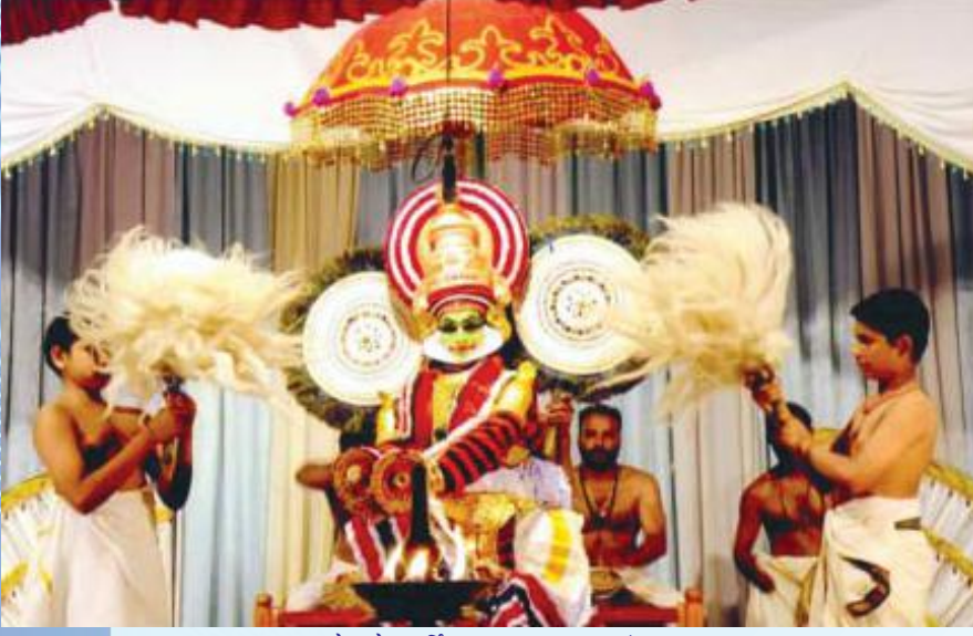
शतमानोत्सवे प्रदर्शितकृष्णनाट्यस्य एकं दृश्यम्।