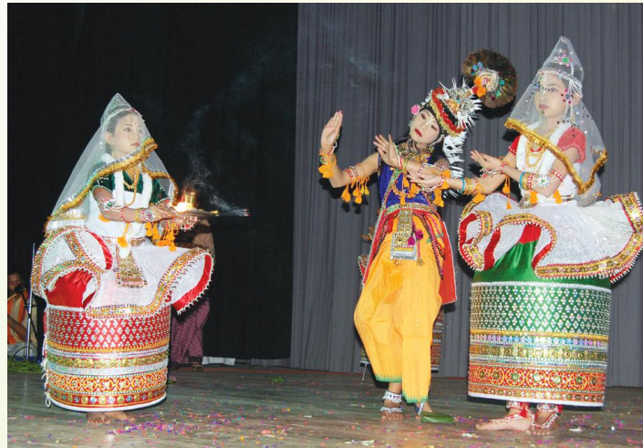
मणिपुरी-रासनृत्यं प्रदर्शयन्त्यः राधामाधव-सं.म.विद्यालयस्य छात्र्यः