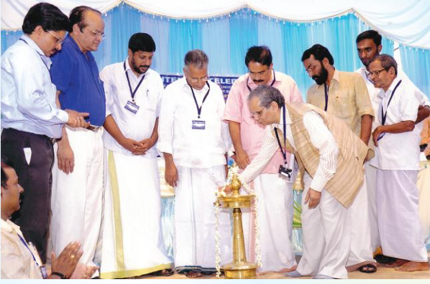
शतमानमहोत्सवस्य उद्घाटनावसरे कुलपतिः अन्ये च