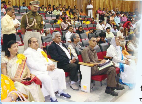
शाकुन्तलं वीक्षमाणाः राज्यपालप्रमुखाः प्रेक्षकाः