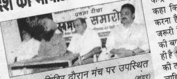
संस्कृत शिविर दौरान मंच पर उपस्थित संस्कृत शिविर दौरान मंच पर उपस्थित अतिथिगण।