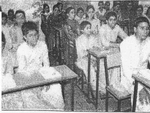
पाठशाला स्थित अनौपचारिक संस्कृत केंद्र में पढ़ते बच्चे व युवा।