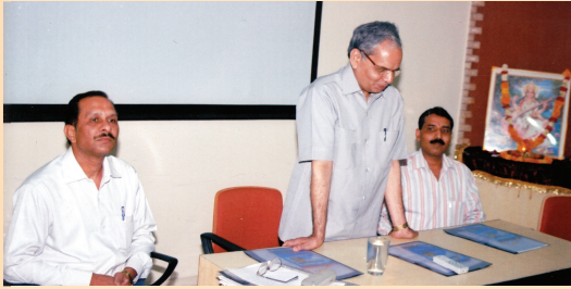
विद्वद्गणं सम्बोधयन् राधावल्लभत्रिपाठी

चित्रे दृश्यते सी.आर्.के. मूर्तिः, रत्नमोहनझाः च