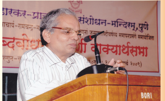
पुण्यपत्तने भ.प्रा.वि.सं.मन्दिरे शाब्दबोधविषयिणीं वाक्यार्थसभां सम्बोधयन् कुलपतिः