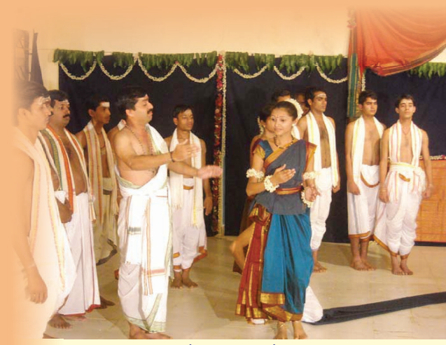
शकुन्तलायै भावपूर्णं सौप्रस्थानिकम्