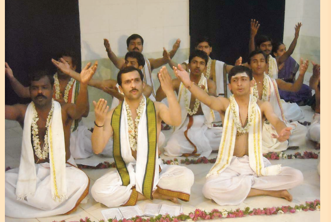
शृङ्गेर्या प्रवृत्त-नाट्यकार्यशालासम्बद्धानि विविधानि दृश्यानि