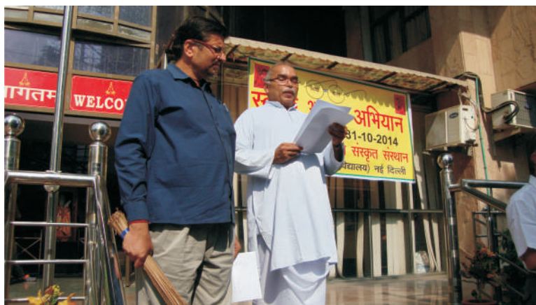
स्वच्छ भारत अभियान में स्वच्छता की शपथ दिलाते हुए संस्थान के अधिकारी

राष्ट्रीय संस्कृत संस्थान, नई दिल्ली के मुख्यालय सहित देश के विविध प्रान्तों में स्थित सभी 11 परिसरों में दिनांक 25.09.2014 से 31.10.2014 तक स्वच्छ-भारत-अभियान का आयोजन किया गया। इस अवधि के दौरान विविध प्रकार की स्वच्छता-सम्बन्धि-क्रियाकलापों का अनुष्ठान किया गया। इन कार्यक्रमों में सभी अधिकारियों, शिक्षकों, छात्रों एवं कर्मचारियों ने बढ़-चढ़कर हिस्सा लिया। दिनांक 02.10.2014 को गाँधी जयन्ती के अवसर पर मुख्यालय, नई दिल्ली सहित सभी परिसरों में स्वच्छता-स्थापनार्थ शपथ-ग्रहण का आयोजन भी किया गया।