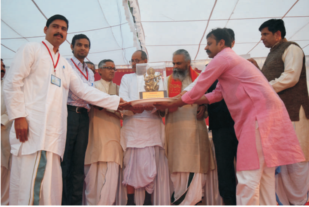
53वीं अ.भा.शा. स्पर्धा में विजयवैजयन्ती को प्राप्त करते हुए कर्णाटक के स्पर्धालु गण