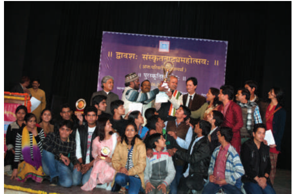
12वाँ संस्कृत नाट्योत्सव की दृश्यावली