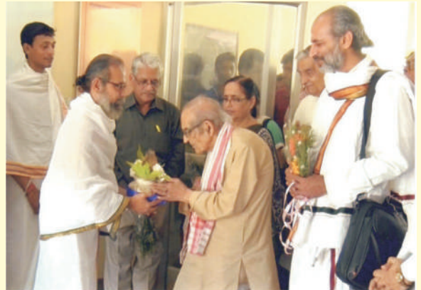
12.12.2014 को गुरुवायूर परिसर में संस्कृत आयोग के द्वारा निरीक्षण के सन्दर्भ में उपस्थित विद्वान