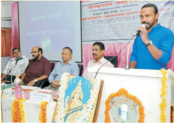
गुरुवायूर परिसर में संपन्न 21 दिवसीय शोधप्रविधि कार्यशाला का एक दृश्य