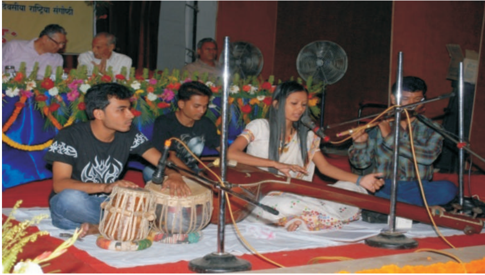
समापन-सत्र में सांस्कृतिक कार्यक्रम