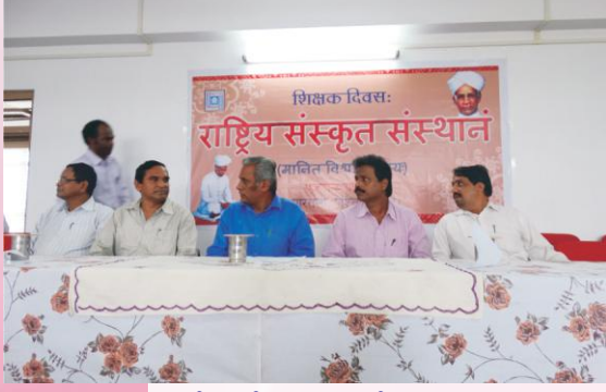
शिक्षकदिवसावसरस्य किञ्चन दृश्यम्