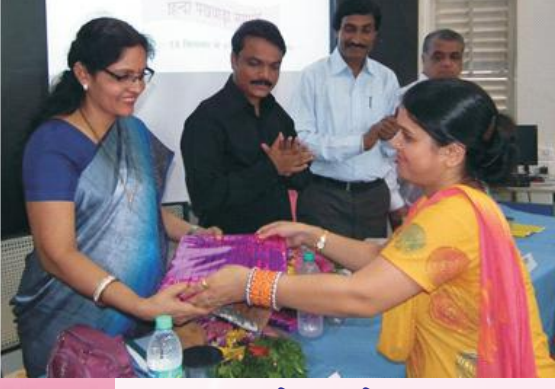
पुरस्कार वितरणस्य किञ्चन दृश्यम्