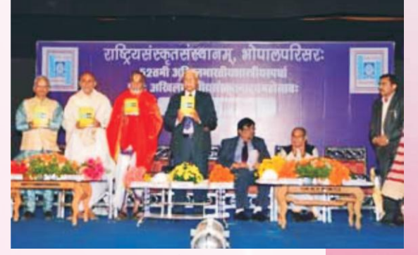
अखिलभारतीयशास्त्रीयस्पर्धायाः उद्घाटनसत्रस्य एकं दृश्यम्