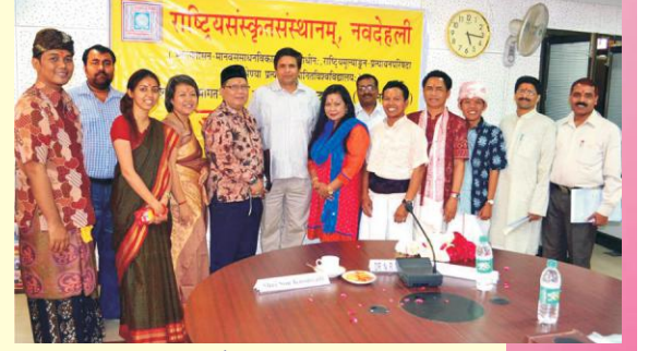
इण्डोनेशियाच्छात्राणां सौप्रस्थानिककार्यक्रमस्य दृश्यम्