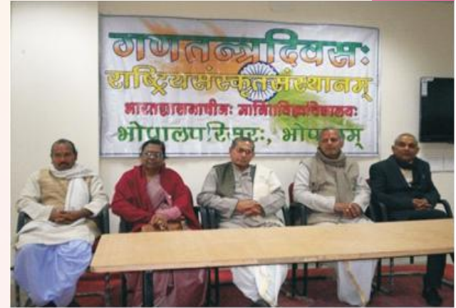
गणतन्त्रदिवसा वसरस्य एकं चित्रम्