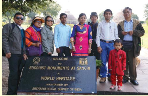
साञ्च्याः शैक्षणिकयात्रायाः चित्रमेकम्