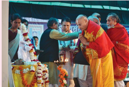
अतिथीनां सम्माननं कुर्वन् परिसरप्राचार्यः