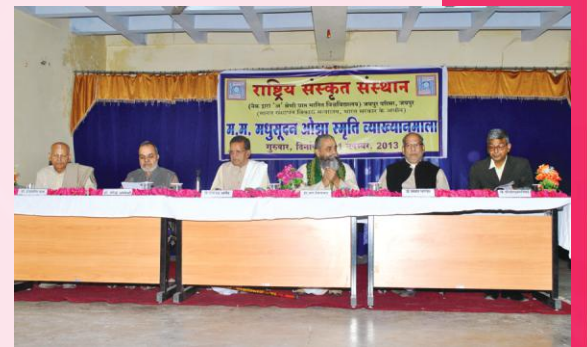
व्याख्यानमालायां मञ्चस्थाः विद्वान्सः