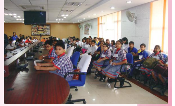
कस्याञ्चित्स्पर्धायां भागं गृह्णन्तः छात्राः