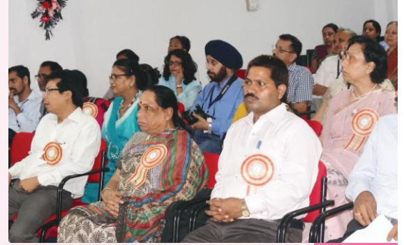
कार्यक्रमे समवेताः विद्वांसः