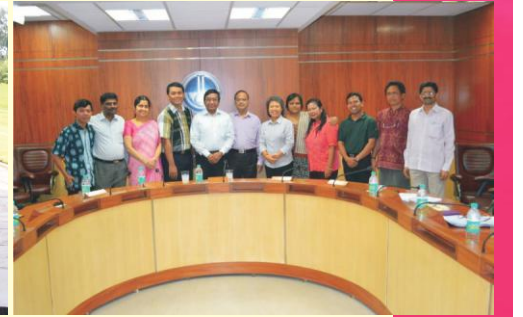
आयुष-संस्थाने शिक्षणस्य किञ्चन दृश्यम्