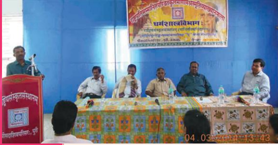
व्याख्यानमालाकार्यक्रमस्य किञ्चन दृश्यम्