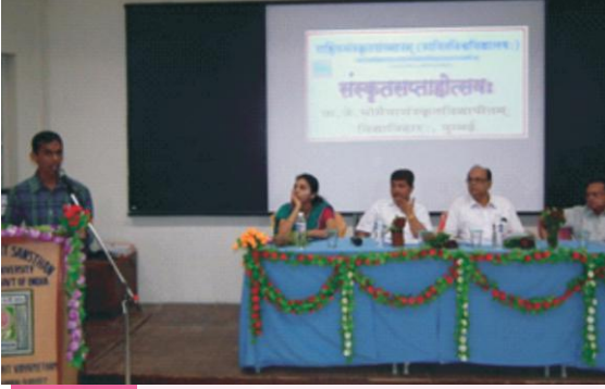
स्पर्धाकार्यक्रमस्य एकं चित्रम्