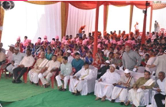
कार्यक्रमे समुपस्थिताः अतिथिप्रमुखाः