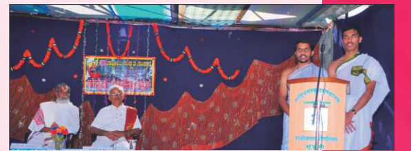
कन्नडराज्योत्सवस्य किञ्चन दृश्यम्

कन्नडराज्योत्सवः - २३.११.२०१३ तमे दिनाङ्के प्राचार्यस्याध्यक्ष्ये अपराह्णे २.३० वादने परिसरस्य सुदुघायां कन्नडराज्योत्सवः समाचरितः, यत्र अभ्यागतत्वेन