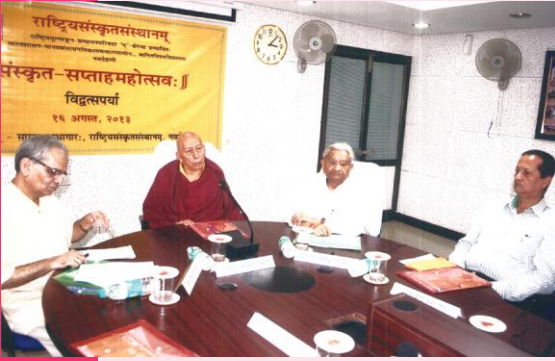
विद्वत्सपर्याकार्यक्रमस्य किञ्चन दृश्यम्