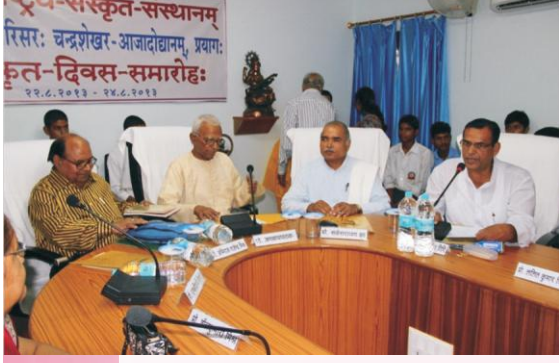
कार्यक्रमे भाषमाणः प्रो. गिरिः