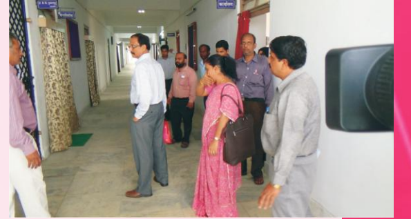
निरीक्षणस्य किञ्चन दृश्यम्