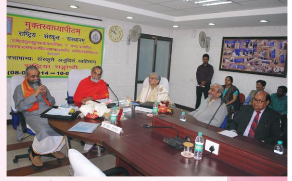
सङ्गोष्ठ्याः उद्घाटनस्य किञ्चन दृश्यम्

अनया सङ्गोष्ठ्या इतरभारतीयभाषाभ्यः संस्कृते अनूदितसाहित्यस्य नैकानि वातायनानि समुद्घाटितानि अभूवन्। निश्चप्रचमेव संस्कृते अनुवादस्य परम्पराविषये अनया सङ्गोष्ठ्या नूतनाः सम्भावनाः समुदेस्यन्ति।