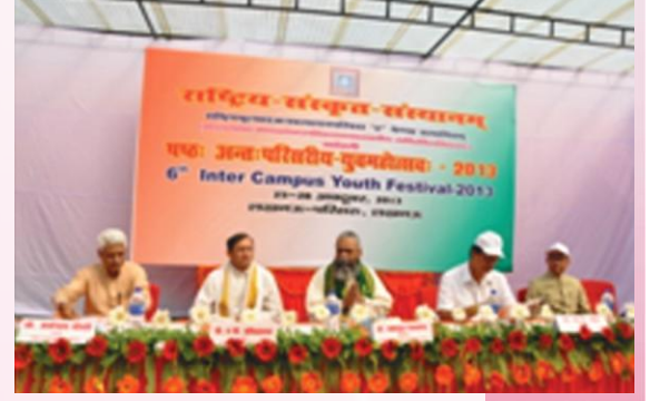
युवमहोत्सवस्य उद्घाटनसत्रस्य दृश्यमेकम्

२७.१०.२०१३ इत्यस्मिन् अहनि परिसरे कुलपतिना कुलसचिवेन च सह संस्थानस्य तत्तत्परिसराणां प्राचार्याणाम् उपवेशनमपि जातम्। उपवेशनेऽस्मिन् मानवसंसाधनविकास-