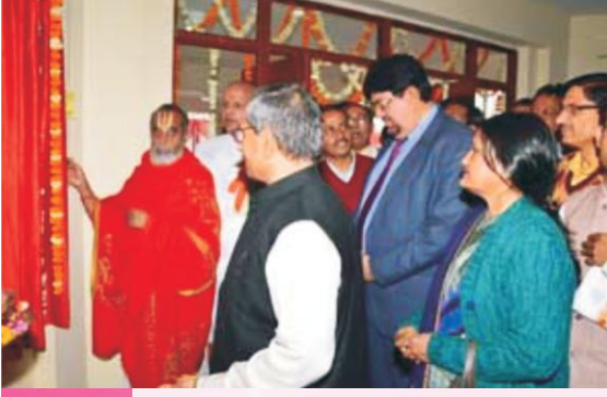
दाक्षी-छात्रावासं समुद्घाटयन् कुलपतिः