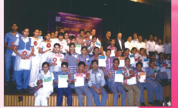
विविधस्पर्धासु प्राप्तपुरस्काराणां छात्राणां समूहचित्रम्