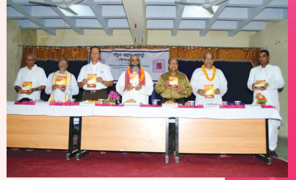
राष्ट्रीयप्राकृतसङ्गोष्ठ्यवसरे ग्रन्थं लोकार्पणतः विद्वांसः