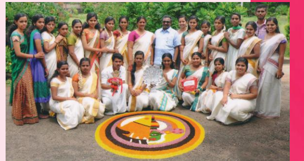
कार्यक्रमाङ्गतया आयोजितस्पर्धायाः किञ्चन दृश्यम्