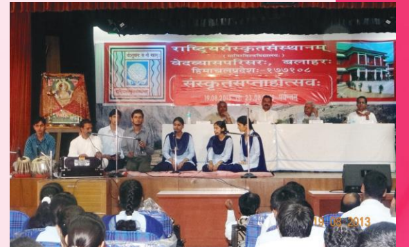
संस्कृतसप्ताहोत्सवावसरे सांस्कृतिककार्यक्रमं प्रस्तुवन्तः छात्राः