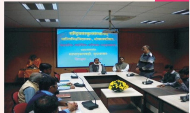
उद्घाटनसमारोहस्य किञ्चन चित्रम्