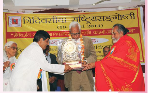
सङ्गोष्ठ्याम् अथितये स्मृतिचिह्नं समर्पयन्तौ कुलपतिः प्राचार्यश्च

श्रीगौरवः आकाशवाणीजम्मूद्वारा प्रसारिते व्यासदिवसे गुरुमहत्त्वविषये व्याख्यानं दत्तवान्।