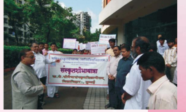
शोभायात्रायाः किञ्चन दृश्यम्

शोभायात्रा - संस्कृतसप्ताहोत्सवस्य आरम्भः १९.०८.२०१३ दिनाङ्के प्रातः १०.०० वादने शोभायात्राद्वारा घटितः। शोभायात्रायां विद्यापीठीयसमस्तपरिवारगणः छात्राश्च भागमवहन्। यात्रेयं सोमैयाविद्याविहारपरिसरे अभवत्। सर्वे छात्राः अध्यापकाः कर्मचारिणश्च संस्कृतमहत्त्वं प्रतिपादयन्ति स्फोरकपत्राणि सम्प्रदर्शयन्तः, सोद्घोषणं, विद्यापीठीयगतिविधीनां प्रदर्शकानि करपत्राणि वितरन्तः सोत्साहं भागमवहन्।