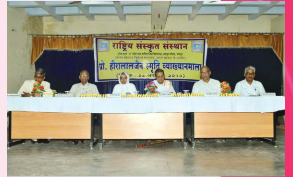
व्याख्यानमालायां मञ्चस्थविदुषां एक चित्रम्