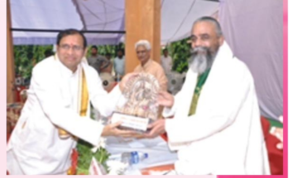
आचार्य रा.देवनाथं सम्मानयन् संस्थानकुलपतिः