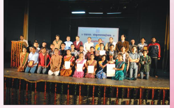
विजेतु-गणस्य एकं चित्रम्