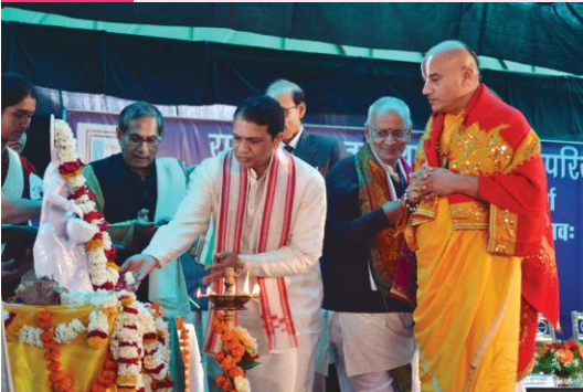
सरस्वतीवन्दनं कुर्वन्तः अतिथिप्रमुखाः