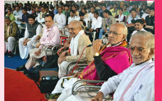
कार्यक्रमे समुपस्थिताः निर्णायकाः