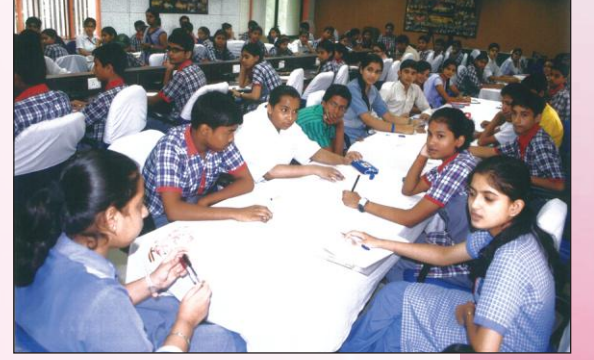
स्पर्धासु भागं गृह्णन्तः छात्राः