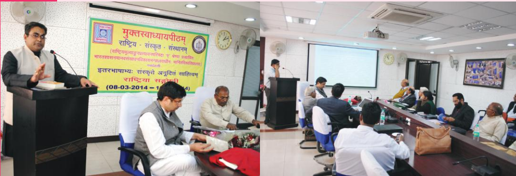
शोधपत्रप्रस्तुति कुर्वन्तौ विद्वांसौ