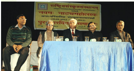
नाट्यमहोत्सवस्य पुरस्कारप्रदानोत्सवे मञ्चासीनाः विद्वांसः अतिथयश्च