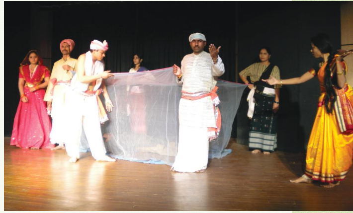
मशकधानी-प्रहसनस्य किञ्चन दृश्यम्