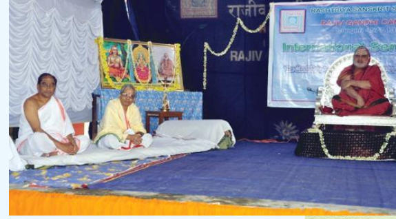
अन्ताराष्ट्रियसङ्गोष्ठ्याः उद्घाटनस्य किञ्चन दृश्यम् कार्यक्रमेऽस्मिन् विविधेषु विषयेषु