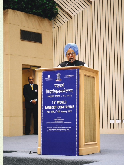
उद्घाटनभाषणं कुर्वन्तः मान्याः प्रधानमन्त्रिणः

यथोक्तं पूर्वं विश्वसंस्कृतसम्मेलनाङ्गतया नैकाः प्रदर्शिन्यः, संस्कृतपुस्तकमेलापकः संस्कृतनाट्योत्सवः ग्रन्थलोकार्पणसमारोहश्च आयोजिताः। 'विश्ववारा'-नाम्ना काचित् प्रदर्शनी राष्ट्रियसंस्कृतसंस्थान-इन्दिरागान्धीराष्ट्रियकलाकेन्द्रयोः संयुक्तोपक्रमे इन्दिरागान्धीराष्ट्रियकलाकेन्द्रस्य माटीघरनामके स्थले संस्थापिता। प्रदर्शिन्यामस्यां संस्कृतपाण्डुलिपयः, संस्कृताभिलेखाः, याज्ञिकपात्राणि संस्कृतं विज्ञानं च प्रदर्शितानि।