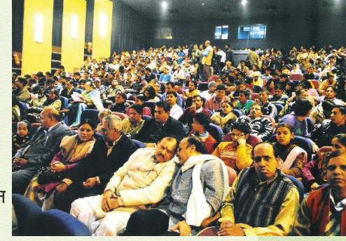
कार्यक्रमम् अवलोकयन्तः प्रेक्षकाः