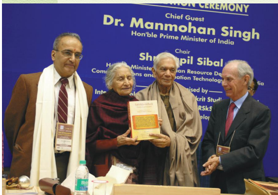
विशिष्टव्याख्यानसत्रावसरे ग्रन्थलोकार्पणं कुर्वन्तः विद्वांसः