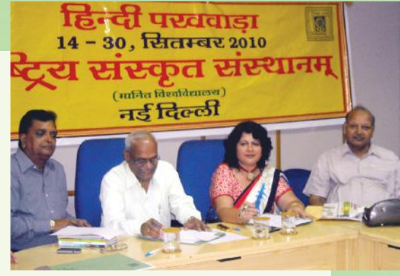
हिन्दीपक्षोत्सवकार्यक्रमे स्पर्धा-पर्यवेक्षणं कुर्वन्तः विद्वांसः

हिन्दीपक्षोत्सवे संस्थानकर्मचारिणां कृते विविधस्पर्धाः आयोजिताः। आसु स्पर्धासु आहत्य ३९ कर्मचारिणः प्रतिभागितां ग्रहितवन्तः। सुलेख-टिप्पणप्रारूपण(Noting and Drafting)-श्रुतलेख-आशुभाषण-वादविवाद-प्रश्नमञ्च-स्वरचितकाव्यपाठ-हिन्दीगीतसङ्गीत-प्रभृतिस्पर्धाः हिन्दीपक्षोत्सवे समायोजिताः अभवन्। एतासु स्पर्धासु जेतृभ्यः एकचत्वारिंशे स्थापना-दिवसे १५.१०.१० दिनाङ्के पुरस्कारवितरणं करिष्यते इति सूचना हिन्दीपक्षोत्सवस्य समापनकार्यक्रमे प्रसारिताऽभवत्।