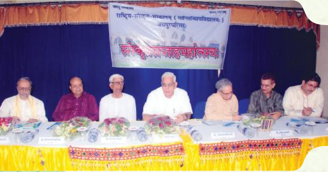
सम्पूर्तिसमारोहसत्रस्य एकं दृश्यम्