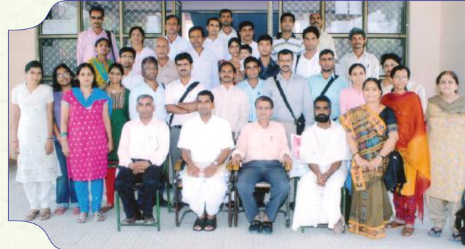
कार्यशालायां भागं गृहीतवन्तः प्रतिभागिनः विद्वांसश्च