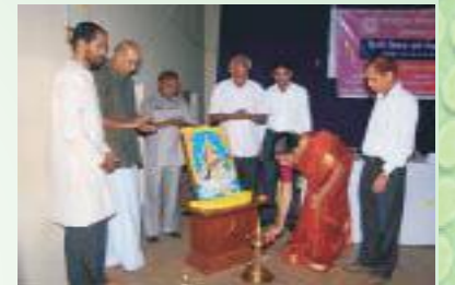
हिन्दीपक्षसमारोहस्य उद्घाटनकार्यक्रमस्य किञ्चन दृश्यम्

परिसरविद्यार्थिनां कृते १५.०९.१० तः २२.०९.१० पर्यन्तं हिन्दीभाषणस्पर्धा, काव्यपाठस्पर्धा, निबन्धलेखनस्पर्धा, हिन्दी-वादविवाद-स्पर्धा काव्यरचनास्पर्धा च आयोजिताः अभवन्। कर्मचारिणां कृते २३.०९.१० तः २७.०९.१० पर्यन्तं हिन्दीभाषणस्पर्धा, निबन्धलेखनस्पर्धा श्रुतलेखनस्पर्धा च आयोजिताः अभवन्। २८.०९.१० दिनाङ्के अस्य हिन्दीपक्षसमारोहस्य सम्पूर्तिकार्यक्रमः पुरस्कारवितरणकार्यक्रमश्च सम्पन्नः।