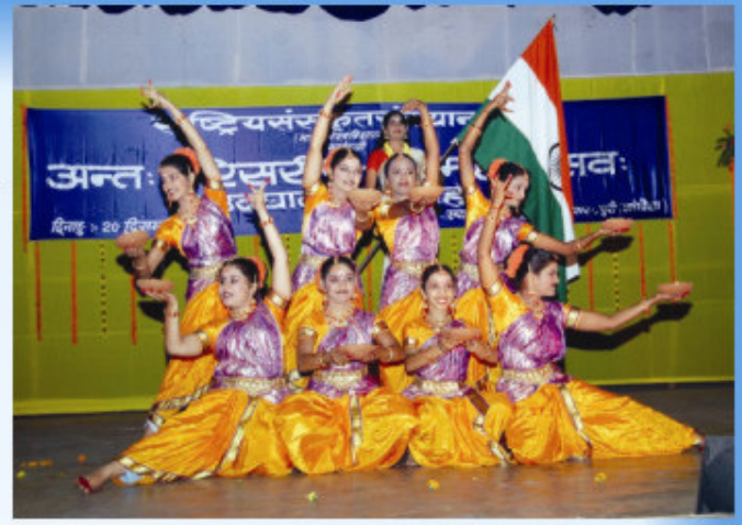
युवमहोत्सवे गुरुवायूरुपरिसरच्छात्रैः प्रस्तुतस्य स्वागतनृत्यस्य एकं दृश्यम्

प्रथमे दिने स्तोत्रपाठस्पर्धा, भित्तिपत्रकस्पर्धा, गीतप्रतिस्पर्धा, रङ्गवल्ली च आयोजिताः अभवन्। सायं भोपालपरिसरच्छात्रदलेन 'सीताच्छायम्' इति रूपकस्य आह्लादजनकप्रस्तुतिः कृता।