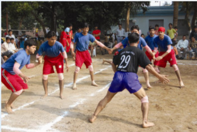
कबड्डी-स्पर्धायाः एकं दृश्यम्