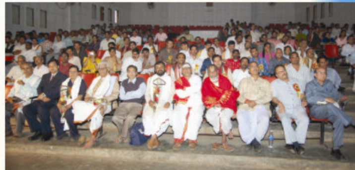
अ.भा.शा.सं.भा. स्पर्धा-कार्यक्रमावसरे समुपस्थिताः प्रेक्षकाः