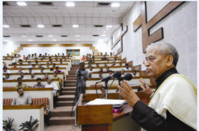
संस्कृतवाङ्मये प्रबन्धविज्ञानमिति विषये भाषमाणः वादिराजपञ्चमुखी