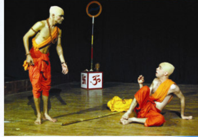
नीपारङ्गमण्डल्या प्रदर्शितस्य भगवदञ्जुकीयस्य दृश्यम्