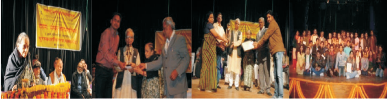
समापन एवं पुरस्कार वितरण समारोह