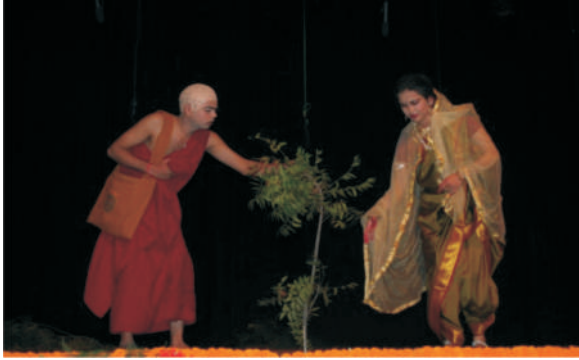
जम्मू परिसर-मृच्छकटिक ( अंक-8 )