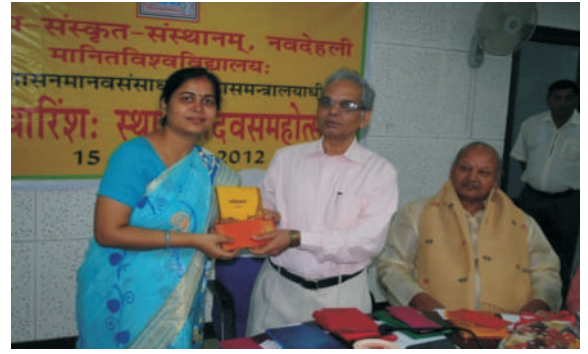
हिन्दी प्रतियोगिताओं हेतु पुरस्कार वितरण समारोह