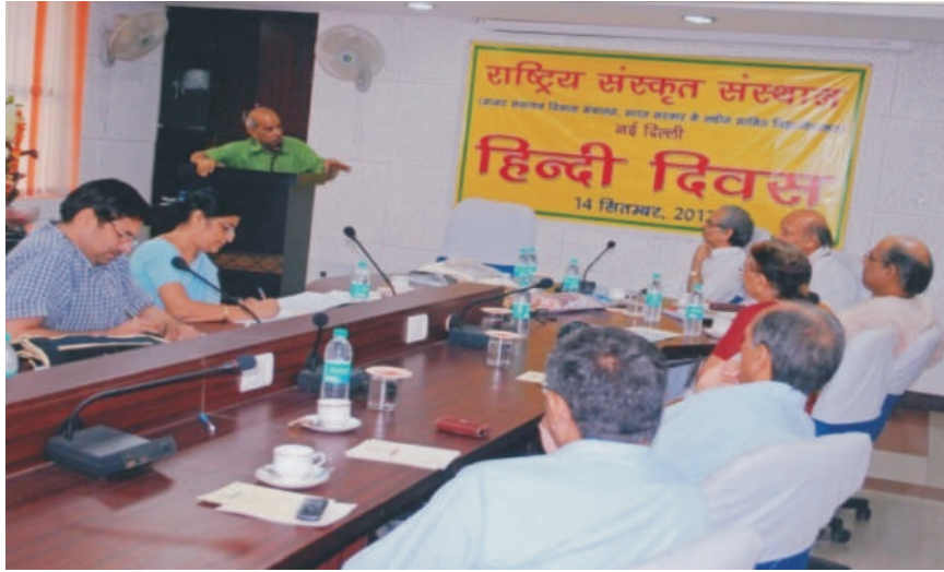
हिन्दी दिवस का उद्घाटन कार्यक्रम

हिन्दी भाषा की लोकप्रियता हेतु विभिन्न तिथियों में कार्यालयीय कर्मचारियों के लिए निम्नलिखित हिन्दी प्रतियोगिताएँ भी आयोजित की गईं। कविता पाठ (विषय- मेरा राष्ट्र मेरी हिन्दी), गीत-संगीत, निबन्ध, नोटिंग एण्ड ड्राफ्टिंग, श्रुतलेख, सुलेख, आशुभाषण, वाद-विवाद तथा प्रश्नमंच। प्रस्तुत प्रतियोगिताओं के निर्णायकों के रूप में हिन्दी भाषा के मर्मज्ञों को आमन्त्रित किया गया। इन प्रतियोगिताओं में सफल प्रतिभागियों को प्रथम, द्वितीय, तृतीय एवं दो सात्वना पुरस्कारों सहित हिन्दी साहित्य की पुस्तकों से स्थापना दिवस (15 अक्टूबर, 2012) कार्यक्रम में सम्मानित भी किया गया।