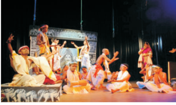
गुरुवायूर परिसर-मृच्छकटिक ( अंक 3-5 )