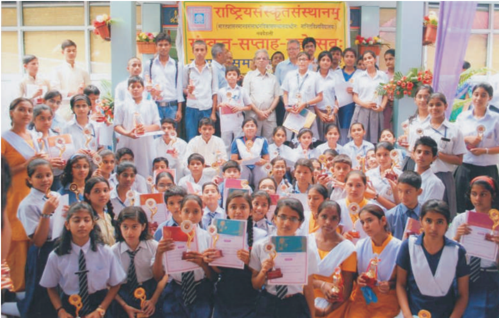
पुरस्कृत छात्र एवं छात्राएँ