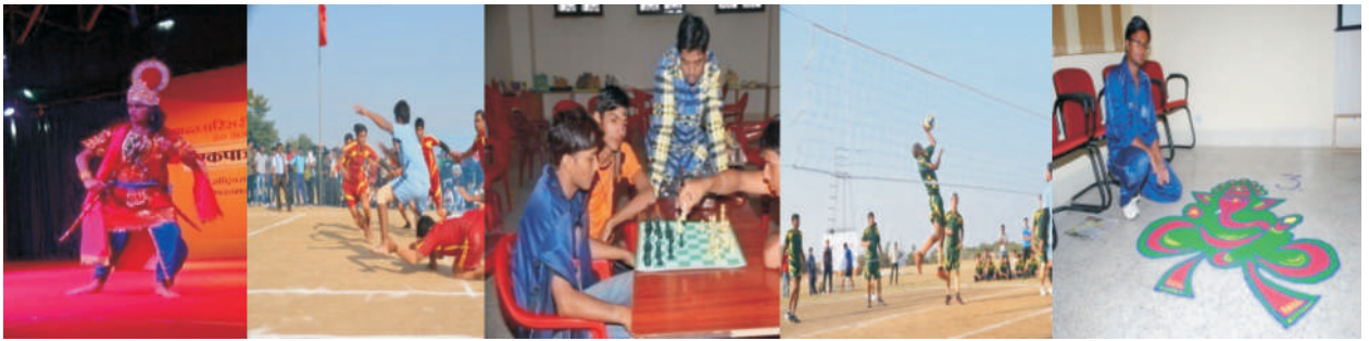
युवा महोत्सव की स्पर्धाओं के दृश्य