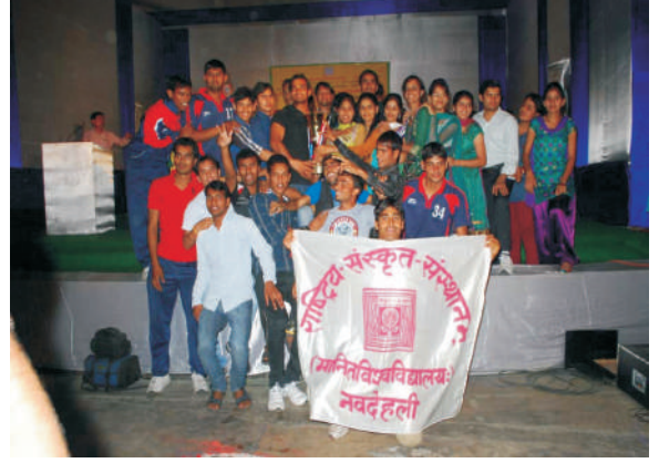
सर्वविजेता-राष्ट्रीय संस्कृत संस्थान