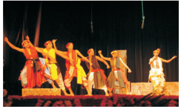
शृंगेरी परिसर-मृच्छकटिक ( अंक 1-2 )