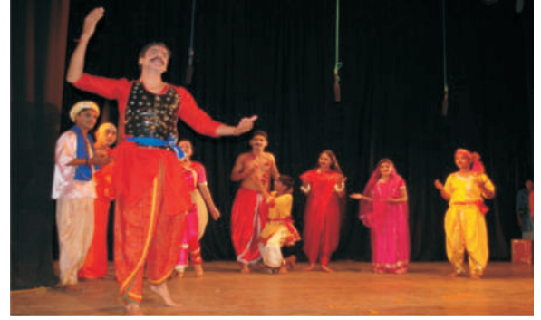
लखनऊ परिसर-मृच्छकटिक ( अंक 9-10 )