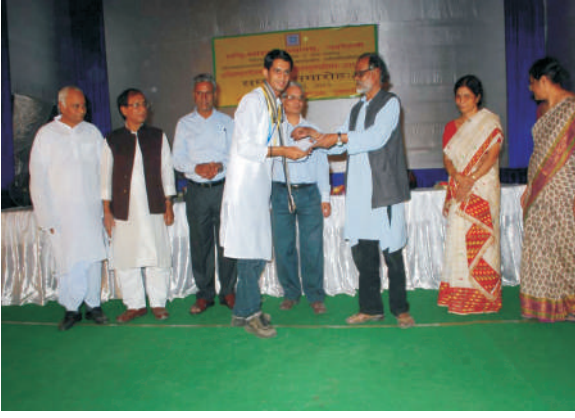
गुवाहाटी में आयोजित अन्तर संस्कृत विश्वविद्यालय युवा महोत्सव के अवसर पर विजेताओं को पुरस्कार देते हुए