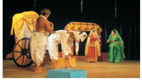
गरली परिसर-मृच्छकटिक ( अंक 6-7 )