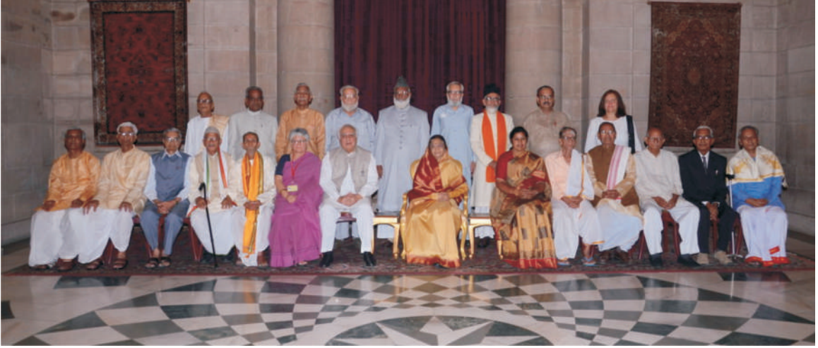
भारत की राष्ट्रपति महामहिम श्रीमती प्रतिभा देवीसिंह पाटील के साथ वर्ष 2010 के लिये राष्ट्रपति समानपत्र तथा महर्षि बादरायण व्यास सम्मान से सम्मानित विद्वानों का सामूहिक चित्र।

मानव संसाधन विकास मंत्रालय, उच्च शिक्षा विभाग, भारत सरकार द्वारा प्रतिवर्ष संस्कृत, पालि, प्राकृत, फारसी तथा अरबी भाषा में निपुणता एवं शास्त्रीय पाण्डित्य के लिए विद्वानों का राष्ट्रपति सम्मान हेतु चयन किया जाता है। साथ ही महर्षि बादरायण व्यास सम्मान हेतु युवा-विद्वानों को भी राष्ट्रपति सम्मान से प्रोत्साहित किया जाता है। प्रत्येक वर्ष स्वतन्त्रता दिवस की पूर्व सन्ध्या पर भारत के महामहिम राष्ट्रपति महोदय सम्मानित विद्वानों की घोषणा करते हैं। इसी क्रम में वर्ष- 2010 एवं 2011 का राष्ट्रपति सम्मान समारोह दिनांक: 19.6.2012 को राष्ट्रपति भवन में सफलतापूर्वक सम्पन्न हुआ, जिसमें महामहिम राष्ट्रपति श्रीमती प्रतिभा देवी सिंह पाटील महोदया द्वारा निम्नलिखित विद्वानों को उनके द्वारा दिए गए संस्कृत, फारसी, अरबी तथा पालि/प्राकृत भाषा में योगदान के लिए राष्ट्रपति सम्मान पत्र से सम्मानित किया -