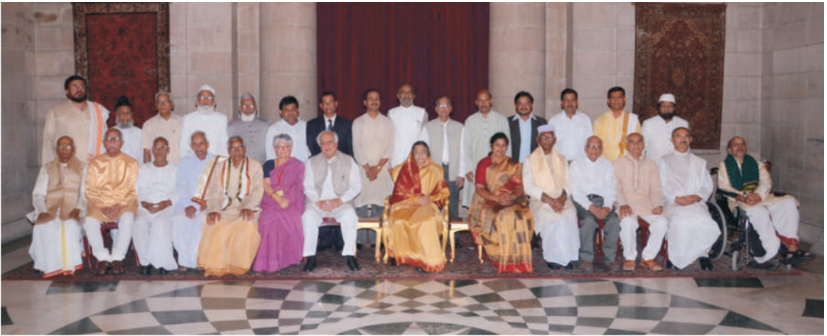
भारत की राष्ट्रपति महामहिम श्रीमती प्रतिभा देवीसिंह पाटील के साथ वर्ष 2011 के लिये राष्ट्रपति समानपत्र तथा महर्षि बादरायण व्यास सम्मान से सम्मानित विद्वानों का सामूहिक चित्र।