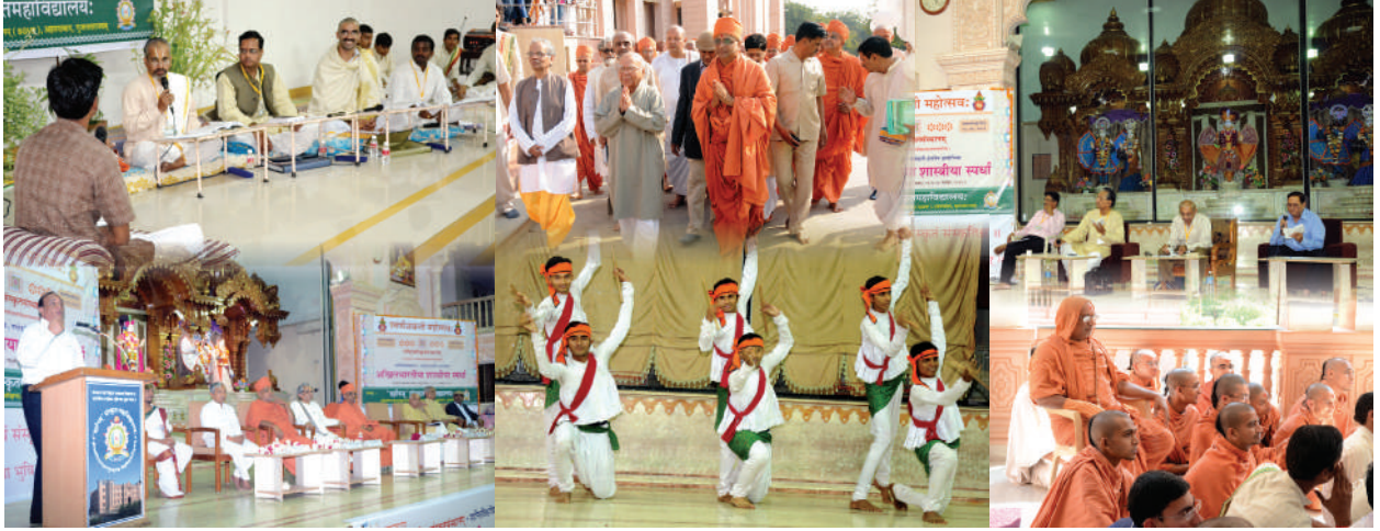
अखिल भारतीय भाषण प्रतियोगिता के मुख्य क्षण