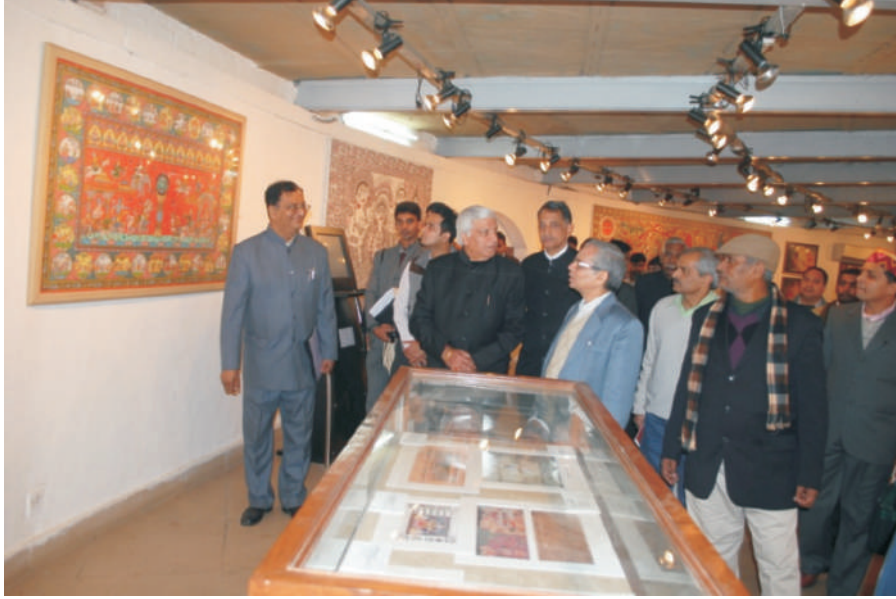
इन्दिरा गांधी राष्ट्रीय कला केन्द्र में "विश्ववारा" प्रदर्शनी का उद्घाटन समारोह

इस अवसर पर राष्ट्रिय संस्कृत संस्थान द्वारा विभिन्न प्रदर्शनियां भी आयोजित की गईं। 'विश्ववारा' शीर्षक के अन्तर्गत प्रदर्शनी का आयोजन इन्दिरा गांधी राष्ट्रीय कला केन्द्र (IGNCA) के संयुक्त तत्वावधान में हुआ। सभी प्रदर्शनियां वर्ग पाण्डुलिपि विज्ञान और पुस्तकों के विक्रय-केन्द्र का प्रबन्ध इन्दिरा गांधी राष्ट्रीय कला केन्द्र में ही किया गया।