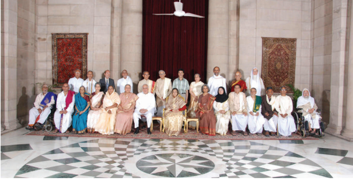
भारत की राष्ट्रपति महामहिम श्रीमती प्रतिभा देवीसिंह पाटील के साथ वर्ष 2008 के लिये राष्ट्रपति समानपत्र तथा महर्षि बादरायण व्यास सम्मान से सम्मानित विद्वानों का सामूहिक चित्र।

राष्ट्रपति सम्मान-पत्र प्रदान करने के लिए 6 मई 2011 को राष्ट्रपति भवन में सम्मान समारोह समायोजित हुआ जिसमें संस्कृत, पालि/प्राकृत, अरबी, फारसी और महर्षि बादरायण व्यास सम्मान 2008, 2009 हेतु चयनित विद्वानों ने भारत की राष्ट्रपति महामहिम श्रीमती प्रतिभा देवी सिंह पाटील के कर कमलों से सम्मानपत्र प्राप्त किया।