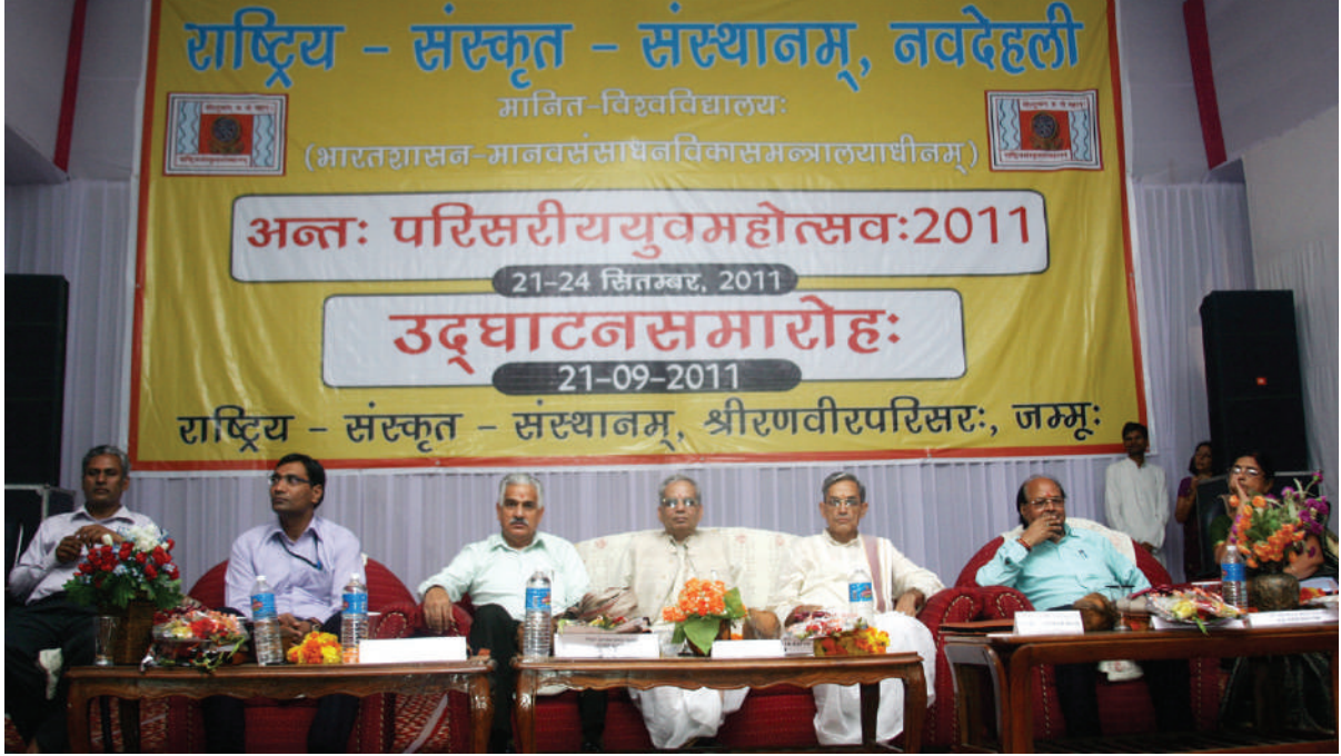
युवा महोत्सव का उद्घाटन सत्र