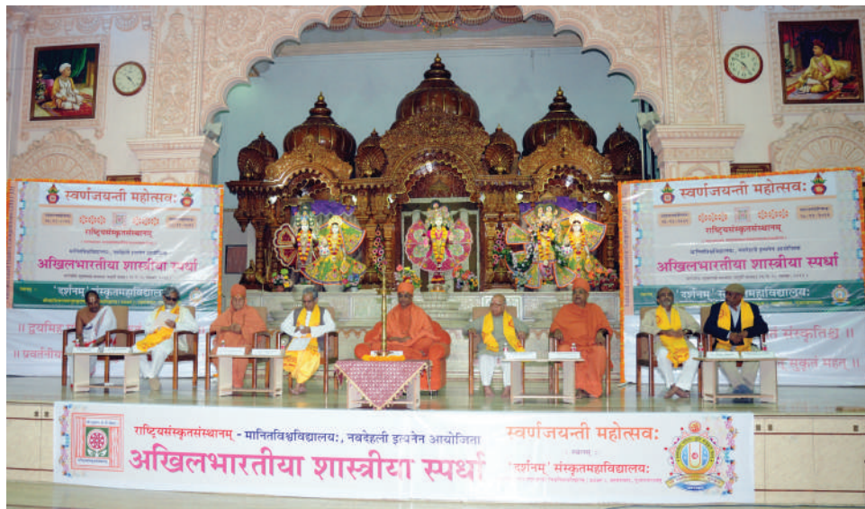
दर्शन संस्कृत महाविद्यालय अहमदाबाद ( गुजरात ) में अखिल भारतीय भाषण प्रतियोगिता का उद्घाटन समारोह

अखिल भारतीय संस्कृत भाषण प्रतियोगिता (स्वर्ण जयन्ती महोत्सव) का आयोजन 26 से 28 नवम्बर 2011 को दर्शनम् संस्कृत महाविद्यालय के भवन में, श्री स्वामीनारायण गुरुकुल विश्वविद्यापीठ, छरोदी, अहमदाबाद में किया गया जिसमें देश के 19 राज्यों से 238 विद्यार्थियों ने 8 शास्त्रों में भाषण स्पर्धा में और सात ग्रन्थों में से शलाका परीक्षा में, चार विषयों में कण्ठस्पर्धा, समस्यापूर्ति और अन्त्याक्षरी प्रतियोगिताओं में भाग लिया।