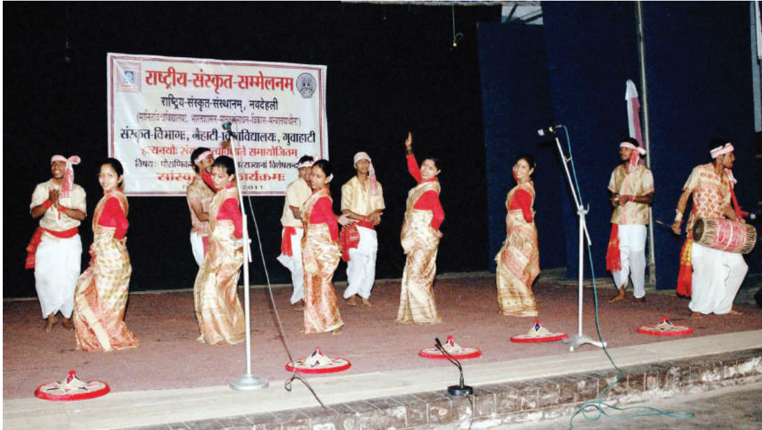
राष्ट्रीय संस्कृत सम्मेलन के अवसर पर प्रस्तुत संस्कृत बिहु नृत्य