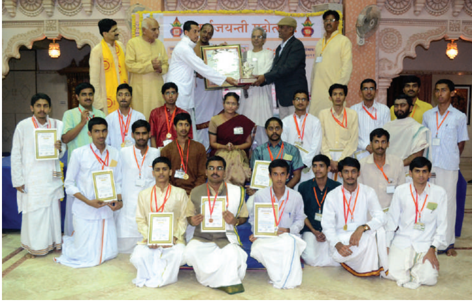
अखिल भारतीय भाषण प्रतियोगिता के विजेता