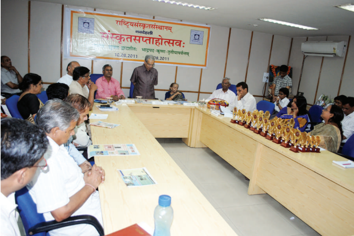
संस्कृत सप्ताहोत्सव का समापन समारोह