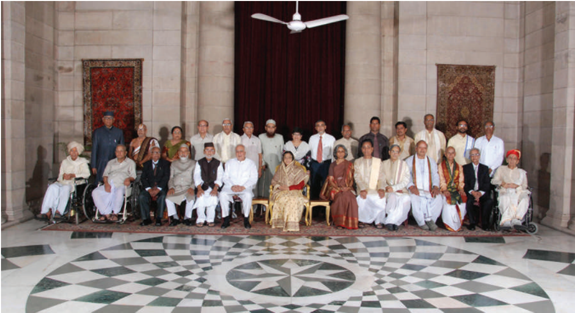
भारत की राष्ट्रपति महामहिम श्रीमती प्रतिभा देवीसिंह पाटील के साथ वर्ष 2009 के लिये राष्ट्रपति समानपत्र तथा महर्षि बादरायण व्यास सम्मान से सम्मानित विद्वानों का सामूहिक चित्र।