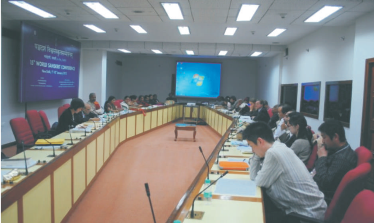
तकनीकी सत्र में बहुविज्ञ विवेचन

विज्ञान भवन में 5 जनवरी, 2012 के मध्याह्न से सम्मेलन के विभिन्न विषयों पर तकनीकी सत्रों का प्रारम्भ हुआ और यह चक्र 10 जनवरी 2012 तक चलता रहा। सम्मेलन में 20 वर्ग थे—वेद, भाषा विज्ञान, महाकाव्य (रामायण और महाभारत) पुराण, तन्त्र और आगम, व्याकरण, काव्य, नाटक, सौन्दर्याभिव्यक्ति (aesthetics), संस्कृत और एशिया की अन्य भाषाएँ और साहित्य, संस्कृत और विज्ञान, बुद्धदर्शन विषयक अध्ययन, जैन दर्शन, दर्शन साहित्य, धार्मिक अध्ययन, कर्मकाण्डीय अध्ययन, शिलालेख विज्ञान, तकनीकी विश्व में संस्कृत, आधुनिक संस्कृत साहित्य, पण्डित-परिषद्, कविसमवाय, विधि एवं समाज, पाण्डुलिपि विज्ञान आदि। इन सत्रों के अतिरिक्त निम्नलिखित विशेष बहुविज्ञ चर्चाएँ (पेनल डिस्कशन) भी आयोजित की गईं—