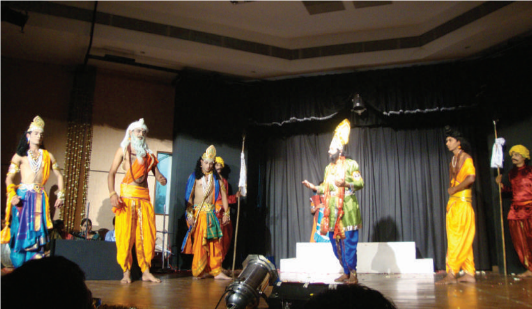
भोपाल परिसर के 'प्रसन्नराघवम्' नाटक का दृश्य