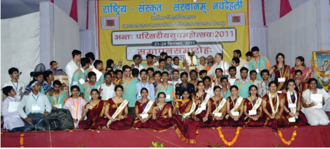
युवामहोत्सव 2011 के विजेता